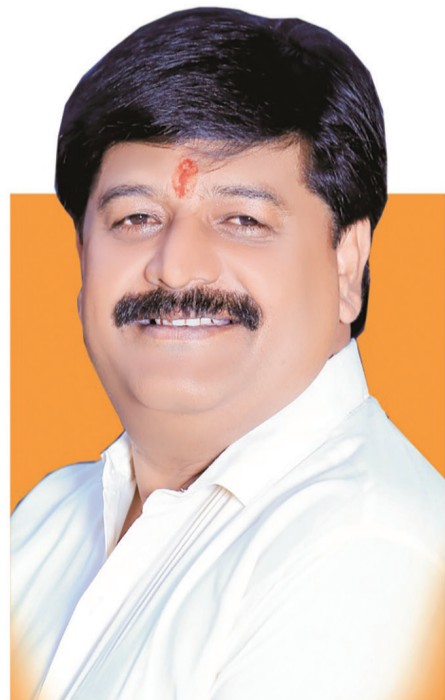
राजेश गित्ते तालुकाध्यक्ष, भाजपा