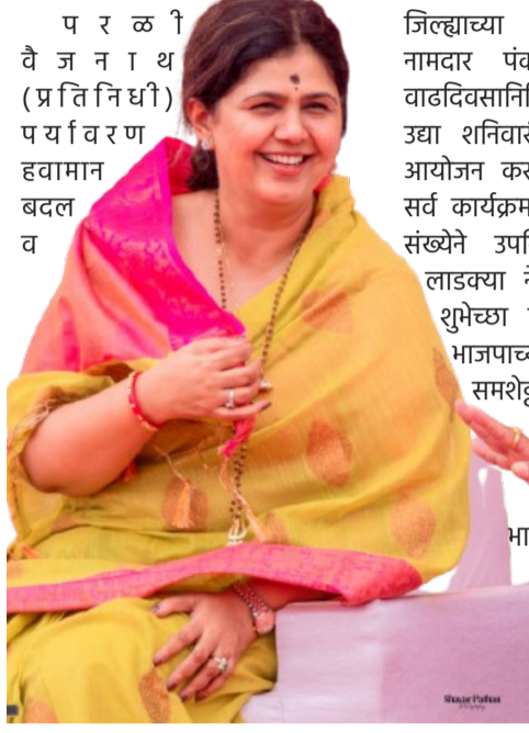
पशुसंवर्धन मंत्री तथा जालना