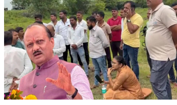
महाराष्ट्राचे उपमुख्यमंत्री शिस्तप्रिय नेते म्हणून प्रसिद्ध आहे. अजित पवार हे त्यांच्या थेट, याच अजित पवारांचा सध्या एक बेधडक विधानासाठी आणि पान 3 वर