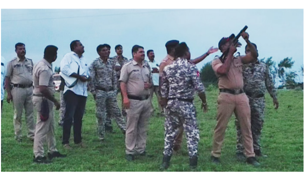
केज : केज शहरात पोलिसांसह दंगल नियंत्रक पथक शुक्रवारी (दि.5) सायनर वाजवित दाखल झाले. त्यानंतर त्यांनी हॅन्डग्रेड व अश्रुधुरचे नळकांडे काढून त्याचे हवेत फायर करायला सुरुवात केली. हा नेमका प्रकार काय सुरु आहे? याची माहिती नागरिकांना नव्हती. त्यामुळे नागरिकांमध्ये चर्चेला पान 3 वर

उघाण आले. याबाबत माहिती अशी की, सध्या गणेशाचे विसर्जन आणि ईद-ए-मिलादच्या अनुषंगाने पोलिस यंत्रणा सज्ज झाली आहे. दरम्यान पोलिसांचा तगडा बंदोबस्त शहरात दाखल झाला असून दंगल नियंत्रण पथक आणि त्यांच्या मदतीला गृहक्षक दल देखील तत्पर आहे. पान 3 वर