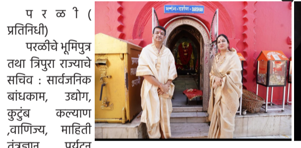
परळी (प्रतिनिधी) परळीचे भूमिपुत्र तथा त्रिपुरा राज्याचे सचिव : सार्वजनिक बांधकाम, उद्योग, कुटुंब कल्याण, वाणिज्य, माहिती तंत्रज्ञान, पर्यटन विभागाचे यांचा वार शुक्रवार दिनांक 5 उल्साहात त्रिपुरा येथील माता त्रिपुरा सुंदरी सरकार यांच्यावर वाढदिवसानिमित्त परळी, अंबाजोगाई पान 3 वर