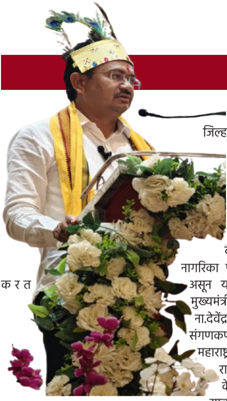
क र त

आदिवासी रेला नृत्याने केले स्वागत ; गडचिरोली येथे जिल्हा स्तरीय मेळावा उत्साहात संपन्न !