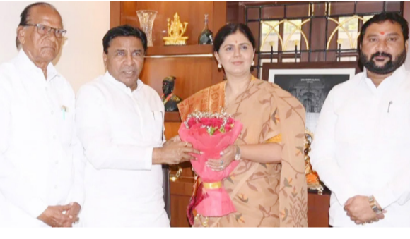
विधानपरिषदेच्या निवडणुकीच्या अकरा जागांची मतमोजणी आज झाली, यात निवडून आलेले पान 3 वर

मुंबई दि. 22 --- स्थानिक स्वराज्य संस्था विधानपरिषद निवडणुकीत भाजपा महायुतीची सरशी झाली असून 17 पैकी 16 जागांवर महायुतीने घवघवीत यश संपादन केले आहे. आजच्या मतमोजणीनंतर विजयी झालेल्या सर्व नवनिर्वाचित आमदारांचे राज्याच्या पर्यावरण व पशुसंवर्धन मंत्री ना. पंकजाताई मुंडे यांनी अभिनंदन करून शुभेच्छा दिल्या आहेत.