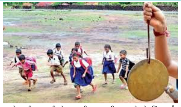
आरोग्याची काळजी घेण्यासाठी शिक्षण विभागाने हा निर्णय घेतल्याची माहिती देण्यात आली आहे. नवीन आदेशानुसार जिल्ह्यातील सर्व शाळा सकाळी 8.00 ते दुपारी 12.30 या वेळेत चालविण्यात येणार आहेत. तीव्र उष्णतेमुळे विद्यार्थ्यांना उष्णता, निर्जलीकरण तसेच उष्णतेशी संबंधित इतर आरोग्यविषयक समस्यांचा सामना करावा लागू शकतो. या संभाव्य धोक्याचा विचार करून विविध शिक्षक संघटनांच्या मागण्या पान 3 वर

बीड, दि. 22 (प्रतिनिधी): राज्यात सध्या वाढलेल्या तापमानाचा आणि उष्णताचा धोका लक्षात घेऊन बीड जिल्हा परिषदेने महत्त्वपूर्ण निर्णय घेतला आहे. मंगळवार, दि. 23 जून 2026 पासून पुढील आदेशपर्यंत जिल्ह्यातील सर्व शाळा सकाळच्या सत्रात भरविण्यात येणार आहेत. याबाबतचे अधिकृत परिपत्रक जिल्हा परिषद प्रशासनाने सोमवारी जारी केले. 'अल निनो'च्या प्रभावामुळे तसेच पावसाच्या लांबलेल्या प्रतीक्षेमुळे जिल्ह्यात तापमानात लक्षणीय वाढ झाली आहे. या पार्श्वभूमीवर विद्यार्थ्यांच्या