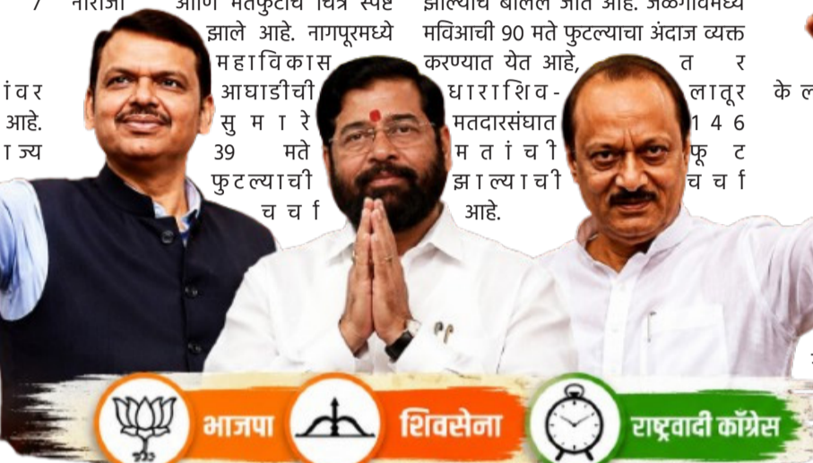
भाजपा शिवसेना राष्ट्रवादी काँग्रेस